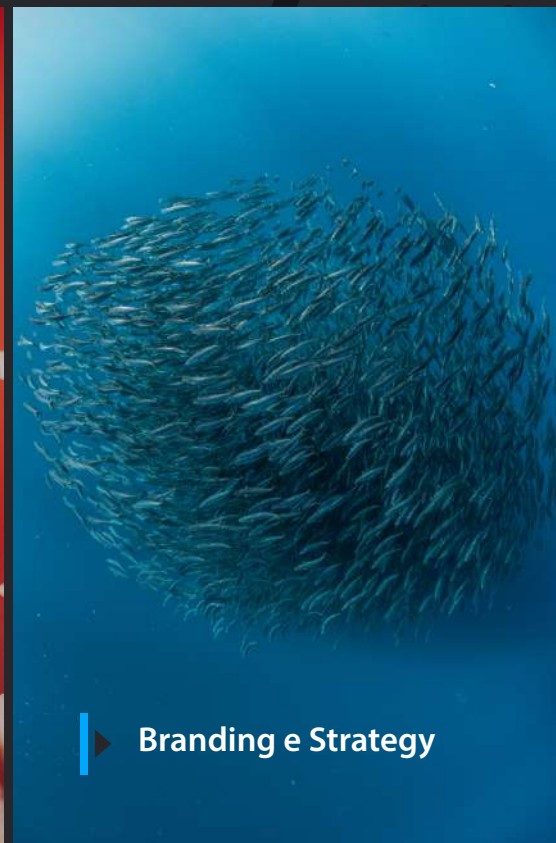
► Branding e Strategy