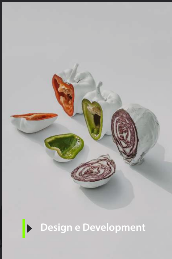
► Design e Development